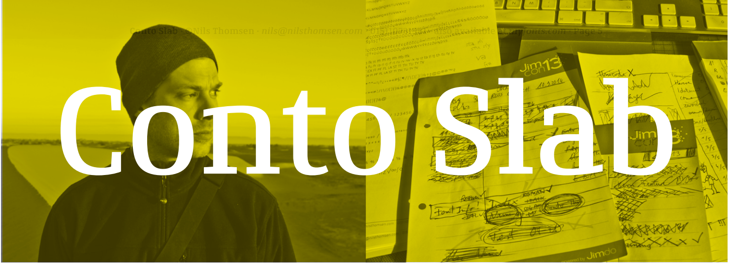
Left Nils in desert Right Final mastering and todo list