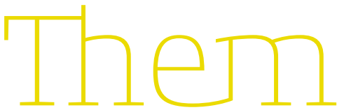
HEADLINE BLACK 20 PT — GRAFIK THIN 100 PT